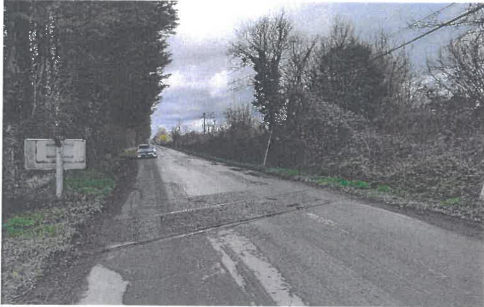
Situation du PN 337,